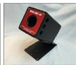
התקן ו תושבת