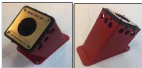
עמדת פריקה שולחנית עם תושבת מובנית