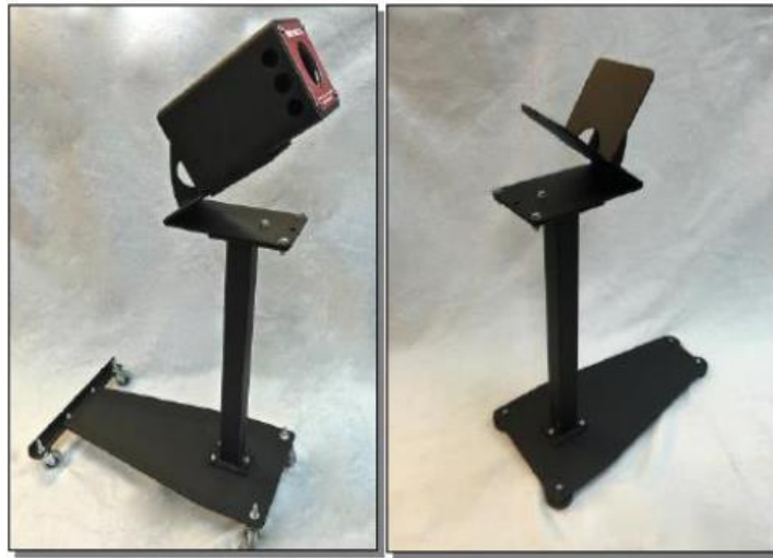
תושבת ניידת עם גלגלים